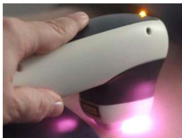
Das Epilations-Handstück des Asclepion MeDioStar NeXT Laser mit integriertem Peltier-Kühlelement

Im Handstück unseres Hochleistungs-Lasers sind mehrere Lasereinheiten (800 und 950 nm) integriert, die parallel Energie abgeben. Der Behandlungserfolg lässt sich an einer leichten Rötung (perifollikuläres Erythem) oder Schwellung (Ödem) des Haarfollikels ablesen.